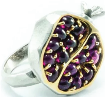
Il mito di persefone, Anello Melograno Artefatto Gioielli Vincitore Contest Artistar Jewels 2016

The event, open to all, starts from February 23 during the fashion week in Milan, at Palazzo Giuseconsulti, from 9.30 to 18.