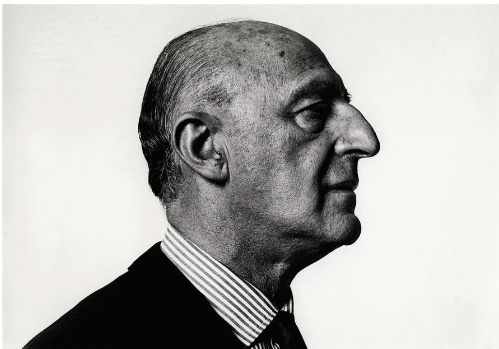
Gillo Dorflès Milano 1966-Portrayed by Ugo Mulas